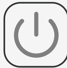
オートシャットオフ