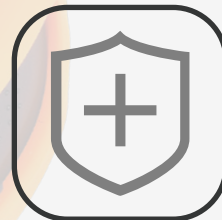
シリコン製ケース