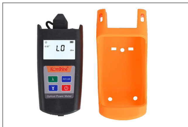
分離型保護カバー