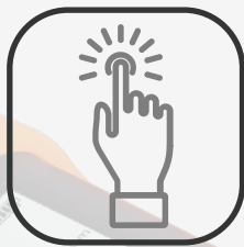
ワンタッチスタート