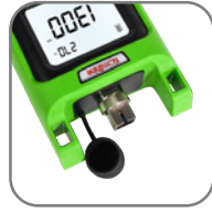
インターフェース アクセサリ