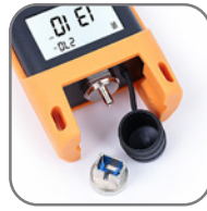
インターフェース アクセサリ