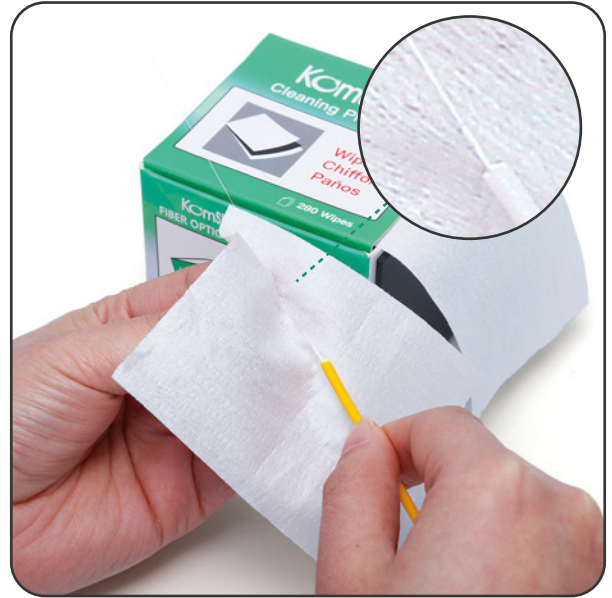
ベアファイバーの直接拭き取り